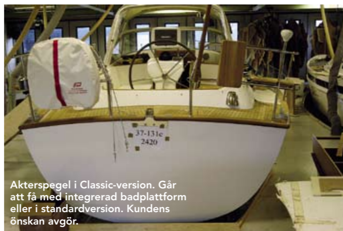
Akterspegel i Classic-version. Går att få med integrerad badplattform eller i standardversion. Kundens önskan avgör.