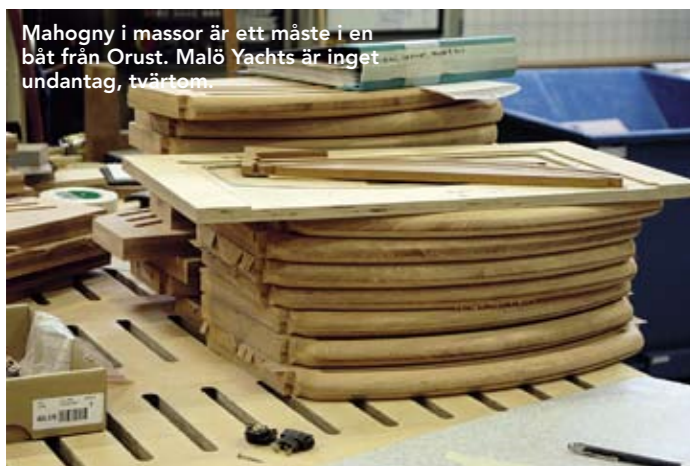
Mahogny i massor är ett måste i en båt från Orust. Malö Yachts är inget undantag, tvärtom.