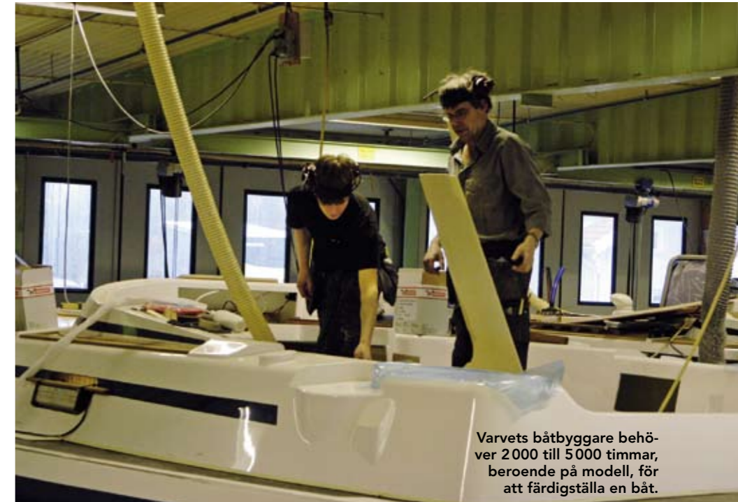
Varvets båtbyggare behöver 2000 till 5000 timmar, beroende på modell, för att färdigställa en båt.